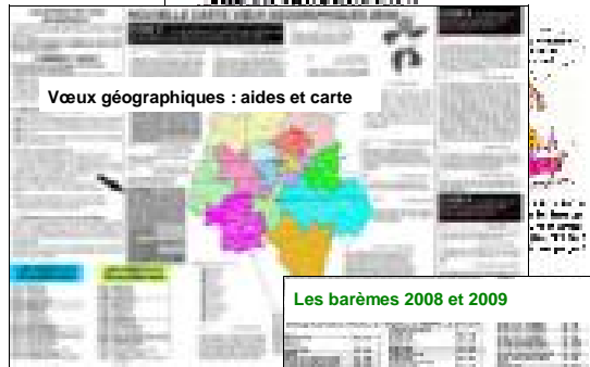
Les barèmes 2008 et 2009